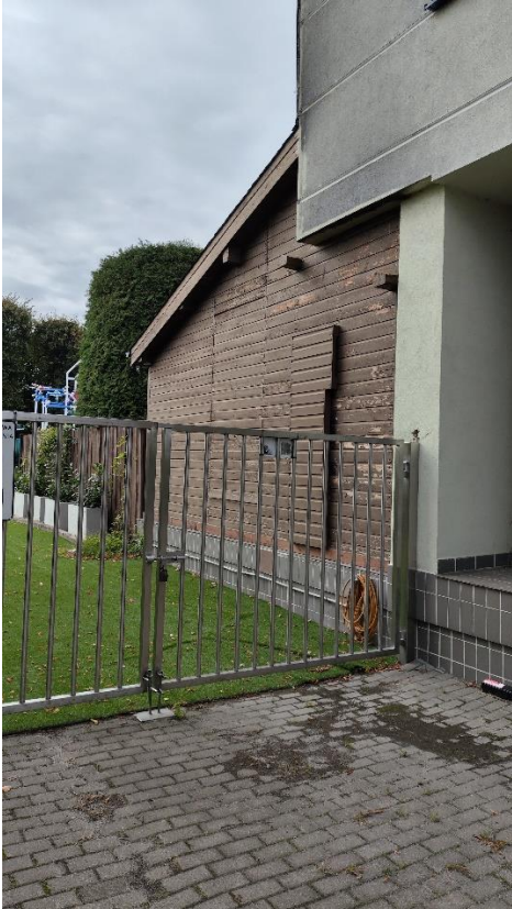
Elewacja wschodnia (drewniana część – bania ruska)