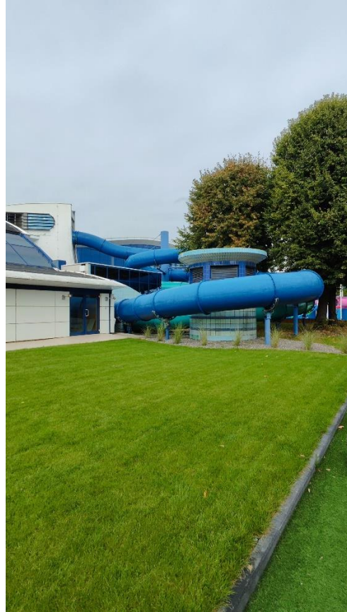
Widok na czerpnię (elewacja wschodnia)