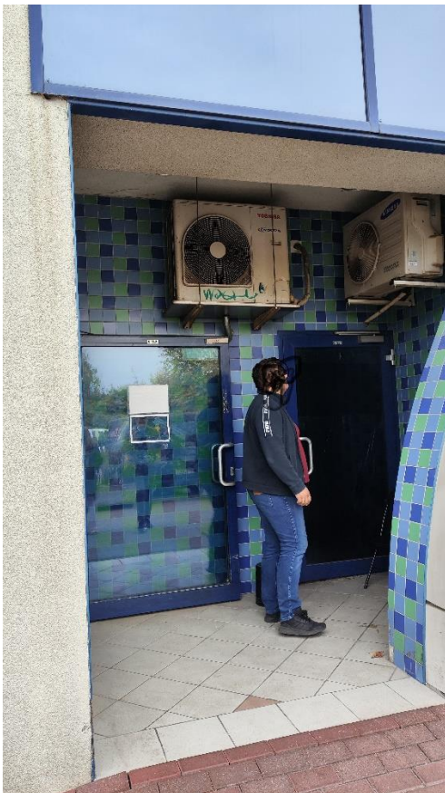
Wnęka elewacji północnej