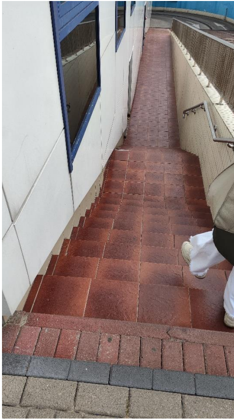
Schody przy pochylni (wjazd do garażu)