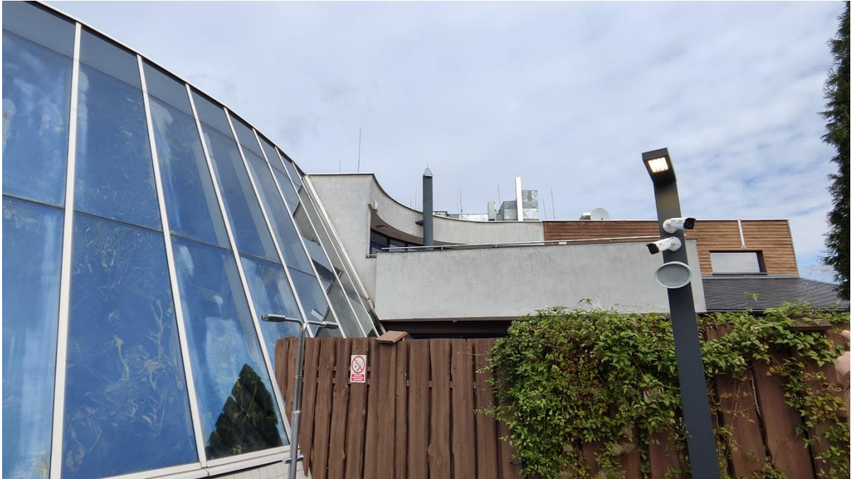
Widok na elewację ogrodu zimowego, część zajmowaną przez banię ruską i taras na I piętrze