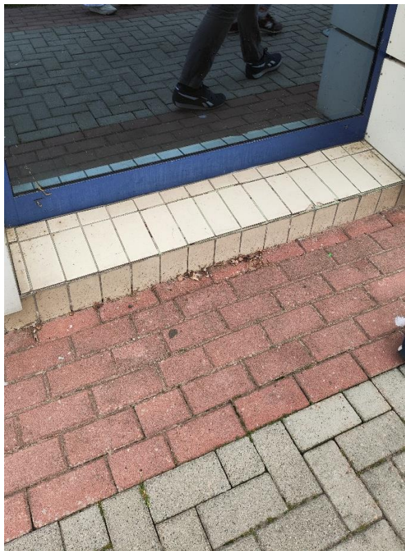
Elewacja frontowa – cokół