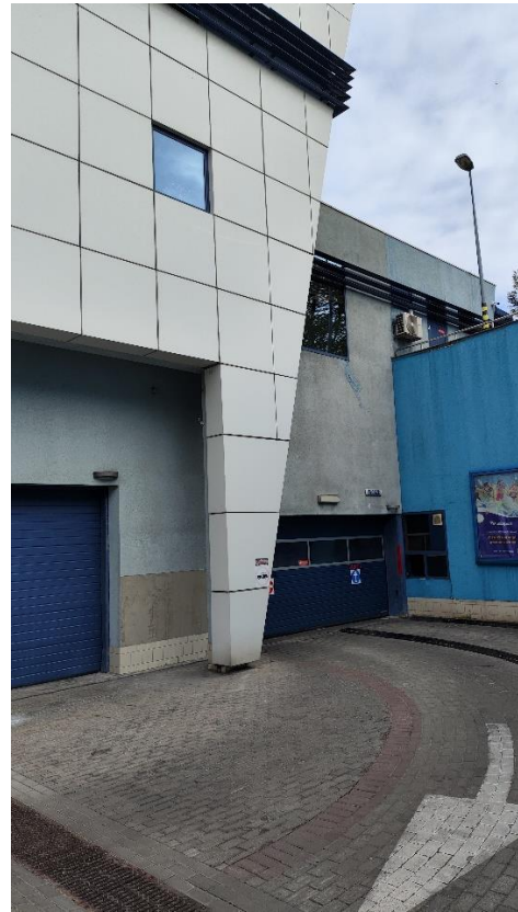
Bramy wjazdowe do garażu