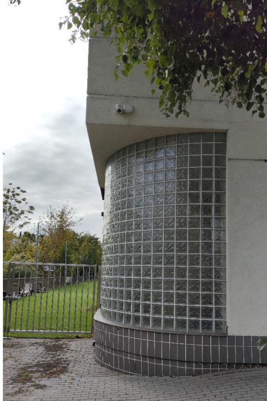
Narożnik elewacji wschodniej i północnej