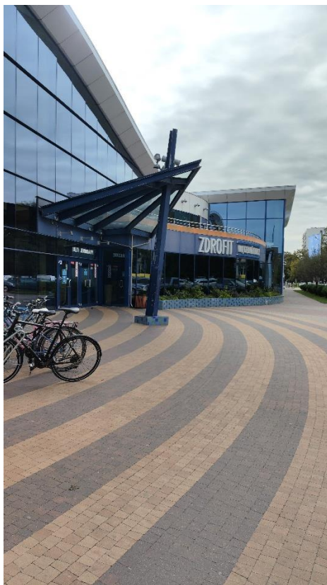
Donice i cokół wzdłuż elewacji frontowej