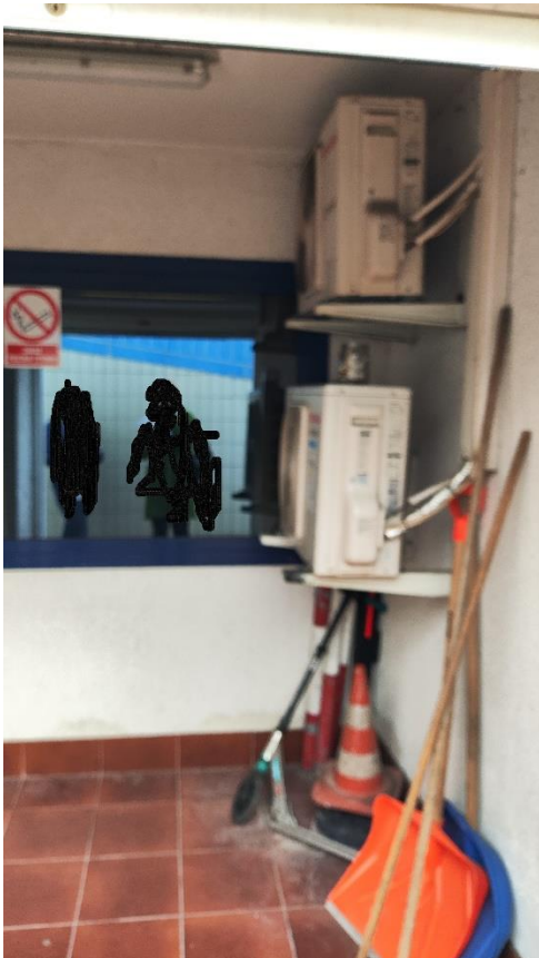
Wnęka przy schodach przy wjeździe do garażu podziemnego