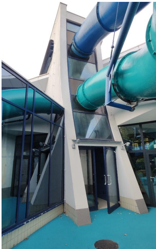
Basen zewnętrzny – ślusarka do wymiany