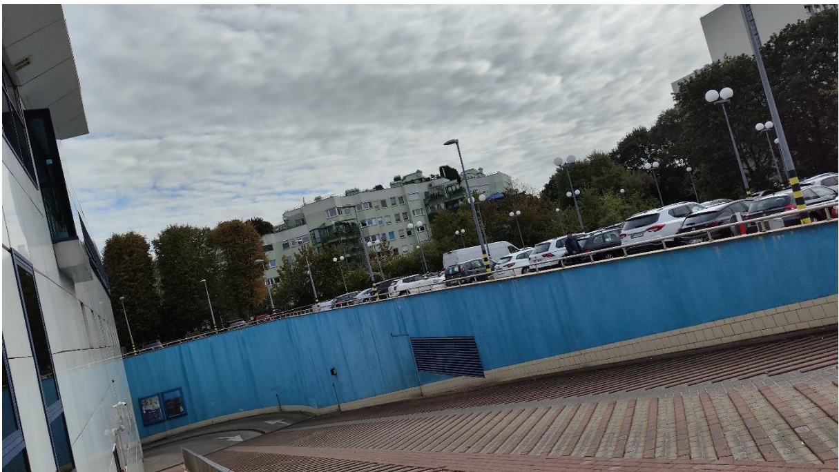
Mur oporowy przy zjeździe do garażu podziemnego