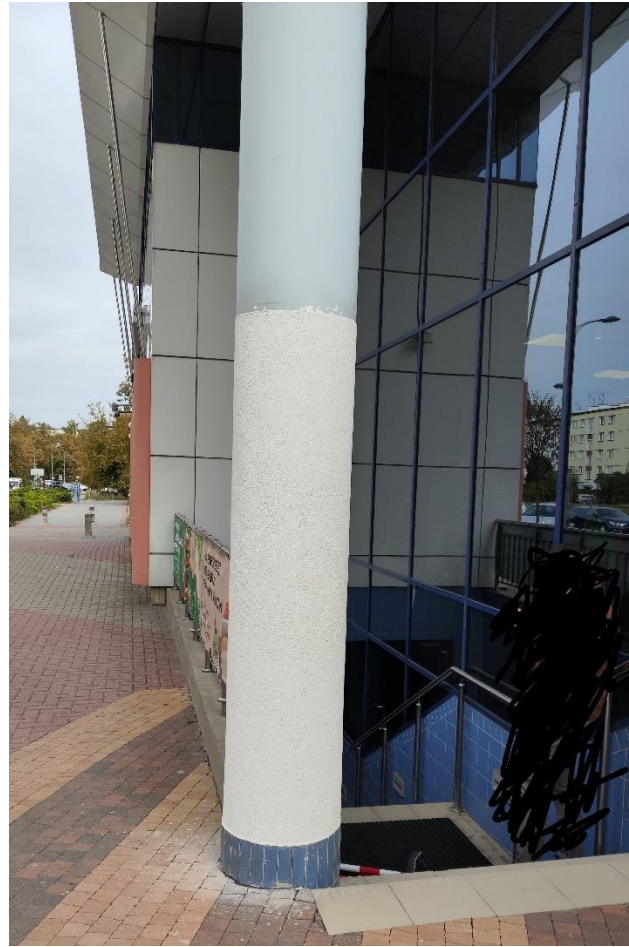
Schody wzdłuż elewacji frontowej