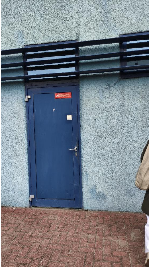
Fragment elewacji południowej (drzwi do wymiany)